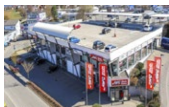
Zimmern ob Rottweil