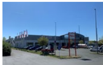
Bamberg - RingCenter